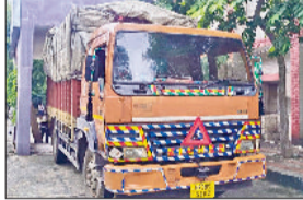
महम। पुलिस द्वारा पकड़ी गई थाना महम में खड़ी अवैध शराब से भरी कैंटर।