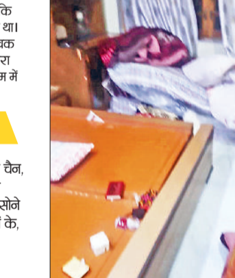
बेड पर फैला सामान

40 ग्राम के सोने के कड़े, 20 ग्राम की सोने की चेन, 40 ग्राम का डायमंड सैट, 40 ग्राम की सोने की अंगुठी, 35 ग्राम डायमंड के कड़े, 20 ग्राम की सोने की चेन, 8 ग्राम की रिंग, 15 ग्राम सोने के कानों के, 500 ग्राम चांदी का सामान और करीब 5 लाख रुपये कैश लेकर फरार हो गए।