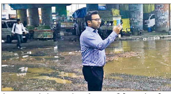
रोहतक। बरसात के दौरान शहर में सफाई व्यवस्था का निरीक्षण करते एसडीएम।

इलाके को स्वच्छता की राष्ट्रीय रैंकिंग में शीर्ष स्थान पर लाने के लिए एसडीएम ने खुद मोर्चा संभाल लिया है। सोमवार दोपहर बाद बिना किसी पूर्व सूचना के बारिश में ही निकलकर शहर के विभिन्न क्षेत्रों की स्वच्छता का निरीक्षण किया। इस दौरान उन्होंने वार्ड 9 बाजार चौक, झंझर मार्ग, डाक घर, झंझर बाईपास के अलावा अन्य महत्वपूर्ण स्थानों का जायजा लिया। निरीक्षण के दौरान जहां-जहां कचरे के ढेर नजर आए, वहां