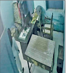
महम। बिजली घर में चोरी करती महिलाएं।