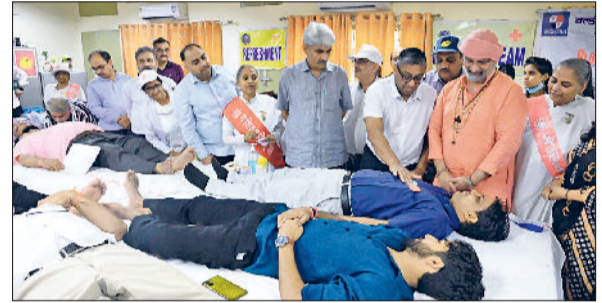
हरिभूमि न्यूज ▶▶ रोहतक